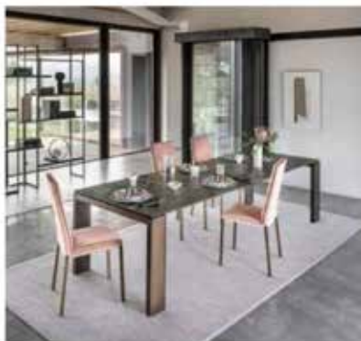
Atlantis di Riflessi

Il tavolo allungabile Atlantis di Riflessi ha un design equilibrato che mette in evidenza la ceramica in lastra unica del piano e delle allunghe a libro che mantengono l'armonia del disegno e delle venature. Le gambe a cavalletto in pressofusione di alluminio verniciato sono disponibili in tantissime varianti: grafite, champagne perlato e ottone, cobalto e titanio spazzolati a mano. Il meccanismo telescopico di estensione è in alluminio anodizzato. Misura L 160/240 x P 90 x H 75 cm, L 180/260 x P 90 x H 75 cm e L 200/280 x P 100 x H 75 cm. www.riflessi.it