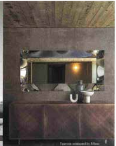
Espresso cabinet by Enea