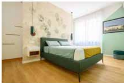
Nella camera matrimoniale il color verde mela (il secondo colore portafortuna secondo il Feng Shui) anima le pareti che fanno da sfondo al letto Max di Twills.

Una volta varcata la porta d'ingresso, «gli spazi sono stati studiati appositamente per essere suddivisi in maniera ottimale in ambienti di zona giorno e zona notte, concedendo così la giusta privacy a seconda delle zone vissute dell'appartamento», spiegano gli architetti dello studio. Per quanto riguarda la zona giorno è stato quindi realizzato un grande open space soggiorno-cucina , suddividendo la stessa dal soggiorno tramite la progettazione di un elemento di porta ferro-vetro, concedendo così trasparenza e profondità agli spazi e, allo stesso tempo, un ambiente cucina idealmente chiuso rispetto al resto della casa. Spostandoci invece nelle stanze dedicate alla zona notte, troviamo un ambiente racchiuso in una parte a se stante dell'appartamento. Un disegno nato per «concedere così piena tranquillità e riservatezza nei momenti necessari», concludono i progettisti. Ovviamente così come nel resto della casa, anche qui l'elemento principale - nonché fil rouge di tutto il lavoro di restyling - è il colore.