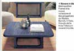
A Basso Tavolo quadrato con base in legno, in legno laccato o in metallo. Altezza regolabile.