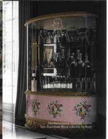
Bar cabinet by Enea