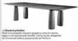
A Chiodi Tavolo rettangolare con base in legno, in legno laccato o in metallo. Altezza regolabile.

Il Cok e i tavoli Cok e Taroni hanno progettato una collezione di tavoli che si adattano a diverse esigenze di vita. I tavoli sono disponibili in diverse versioni, con diverse altezze e materiali.