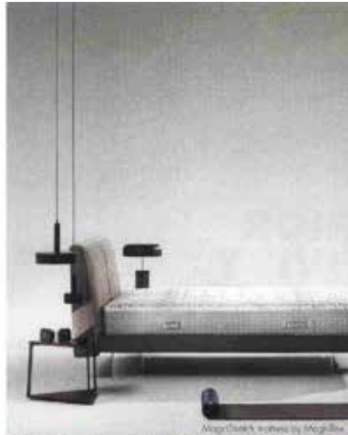
Altopiave's bed by Moggi&Bini