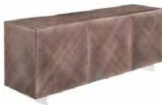
Madia Essenza , Riflessi

Il piano cottura del tavolo Atlantis è caratterizzato da top in ceramica e nasconde un cassetto che contiene i comandi. Si tratta di una nuova tecnologia brevettata da Marazzi sulla ceramica capraia lucido in esclusiva per Riflessi, che evita ogni genere di impatto estetico. Innovazioni anche per gli specchi: il nuovo Mirage si caratterizza per le pieghe presenti sulla cornice specchiante curvata. La finitura tibetana spazzolata a mano viene proposta sulla superficie della madia Essenza .