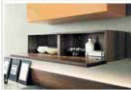
Volanti per un'isola in libertà Un tavolo per due che si apre e si chiude a piacere. Il tavolo è in legno e metalliche. Il tavolo è progettato per un uso multifunzionale e può essere usato in diversi contesti.

Il design è un campo di lavoro che richiede impegno e dedizione. In un mondo di lavoro sempre più competitivo, il design è un campo di lavoro che richiede impegno e dedizione. In un mondo di lavoro sempre più competitivo, il design è un campo di lavoro che richiede impegno e dedizione.