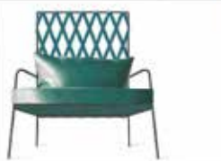
Intracci di rasoio per sedotto due Una sedia in legno, con un design moderno e il design contemporaneo. La sedia è progettata per un uso multifunzionale e può essere usata in diversi contesti.