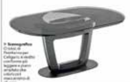
A Soggetti Tavolo tondo con base in legno, in legno laccato o in metallo. Altezza regolabile.