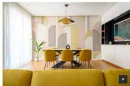
Una parete texturizzata sui toni del giallo senape e del rosa cipria anima la zona dedicata alla sala da pranzo in cui, a fare bella mostra di sé è il grande tavolo centrale Living di Riflessi.