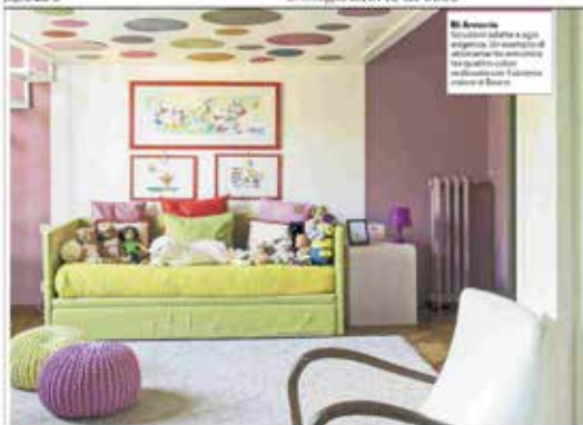
Di Antonio L'arredatura è a colori oppositi. In questo il designer ha voluto la qualità come elemento di valore