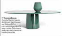
A Tonda Tavolo tondo con base in legno, in legno laccato o in metallo. Altezza regolabile.