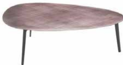
Tavolini Colto. Riflessi