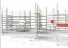
A Libreria con design di Renzo Angiolini. Presentazione della collezione di librerie e di spazi di lettura con la libreria di Foster e Parcorama di Bultrini.

Unifor è un'azienda che si occupa di librerie e di spazi di lettura. È un'azienda che ha una lunga tradizione e una grande esperienza. È un'azienda che ha una grande passione e una grande dedizione. È un'azienda che ha una grande competenza e una grande professionalità. È un'azienda che ha una grande reputazione e una grande credibilità.