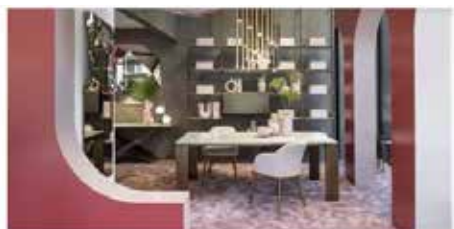
Stilista: Scenario - Riflessi