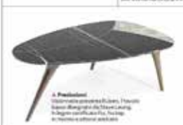
A Piedini Tavolo ovale con base in legno, in legno laccato o in metallo. Altezza regolabile.

Il Cok e i tavoli Cok e Taroni hanno progettato una collezione di tavoli che si adattano a diverse esigenze di vita. I tavoli sono disponibili in diverse versioni, con diverse altezze e materiali.