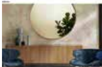
See Tables, Endless 118