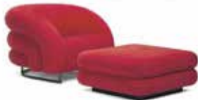
A Sofisse stratigrafia Ispirata alle linee elastiche e stratigra negli anni Trenta, Basso di Amman/Casa è la poltrona con sempre imbottiture tubolari e strati stratigrafici che si adattano su un basamento in acciaio.