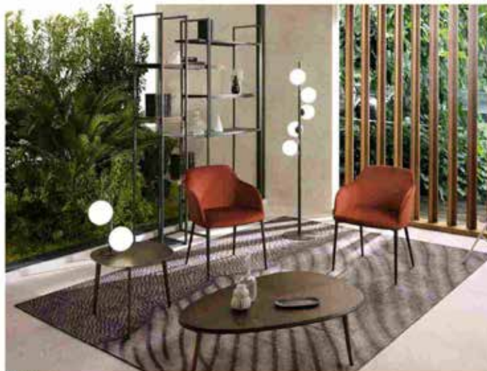
Twist by Riflessi