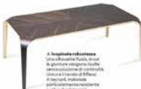
A Insegnata robustezza Una silhouette fluida, in cui la giuntura integra risultava senza soluzione di continuità. Unico è il tavolo di Biffanti in tecnorol, materiale particolarmente resistente (soft e shock termici).